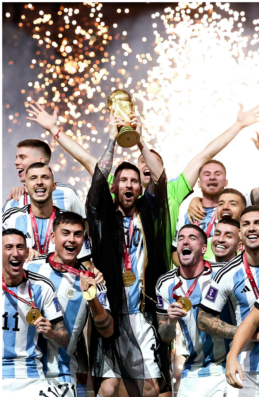
18. Dezember 2022: Messi und sein Team feiern den WM-Sieg in Katar.